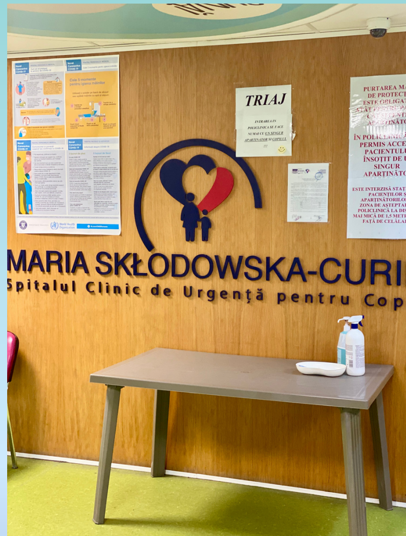
Sectia de Oncologie Pediatrică a Spitalului de Urgenta pentru Copii Maria Sklodowska Curie