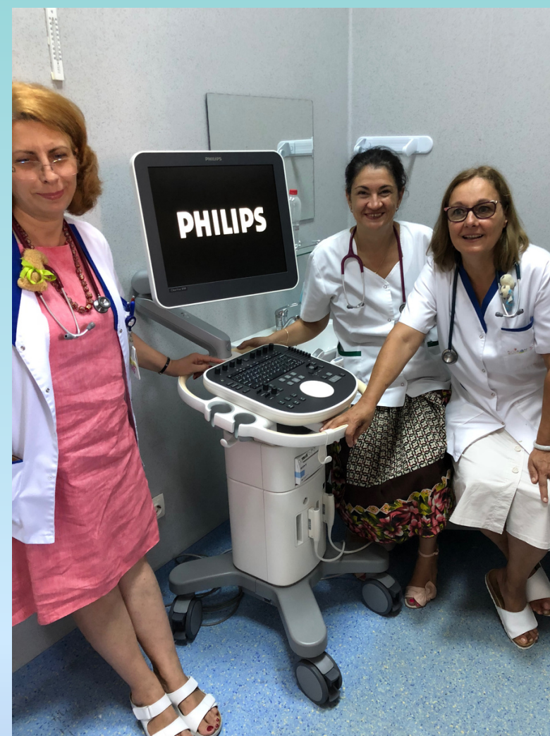
Sectia Pediatrie III a Spitalului Clinic de Urgenta pentru copii Grigore Alexandrescu