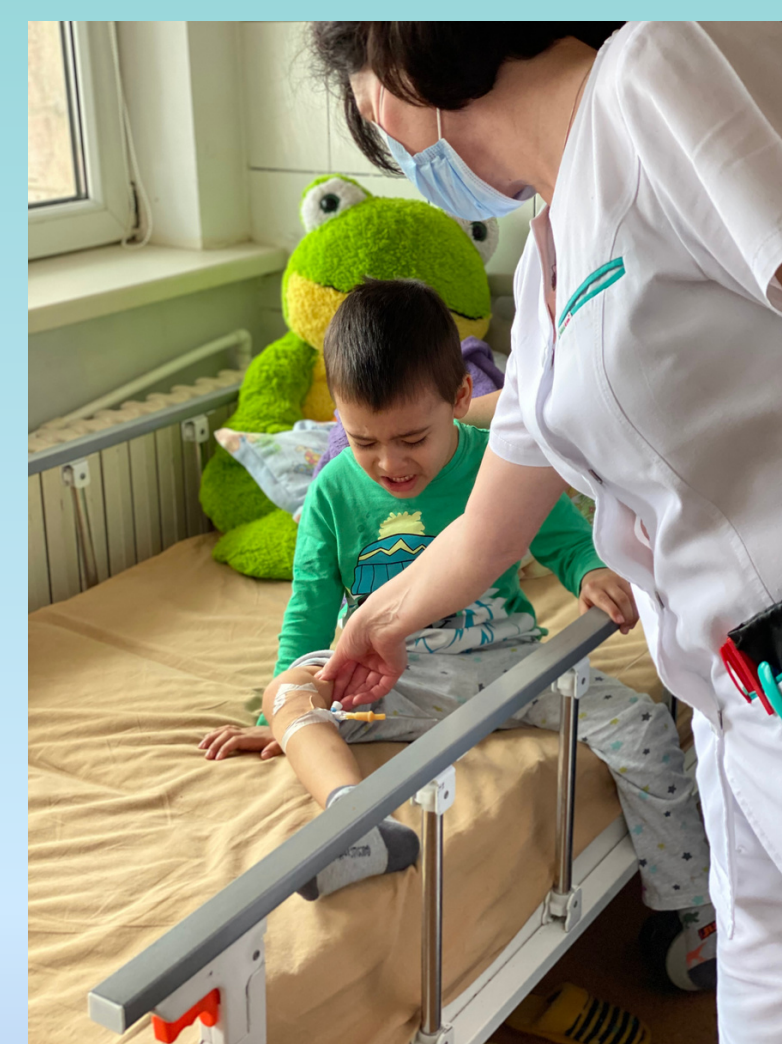
Sectia de Oncopediatrie a Spitalului Judetean Craiova