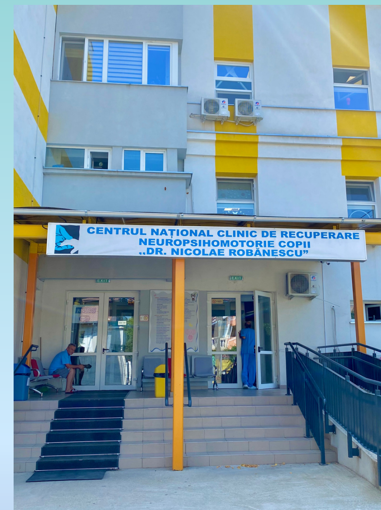
Centrul Național Clinic de Recuperare Neuropsihomotorie Dr. Nicolae Robanescu