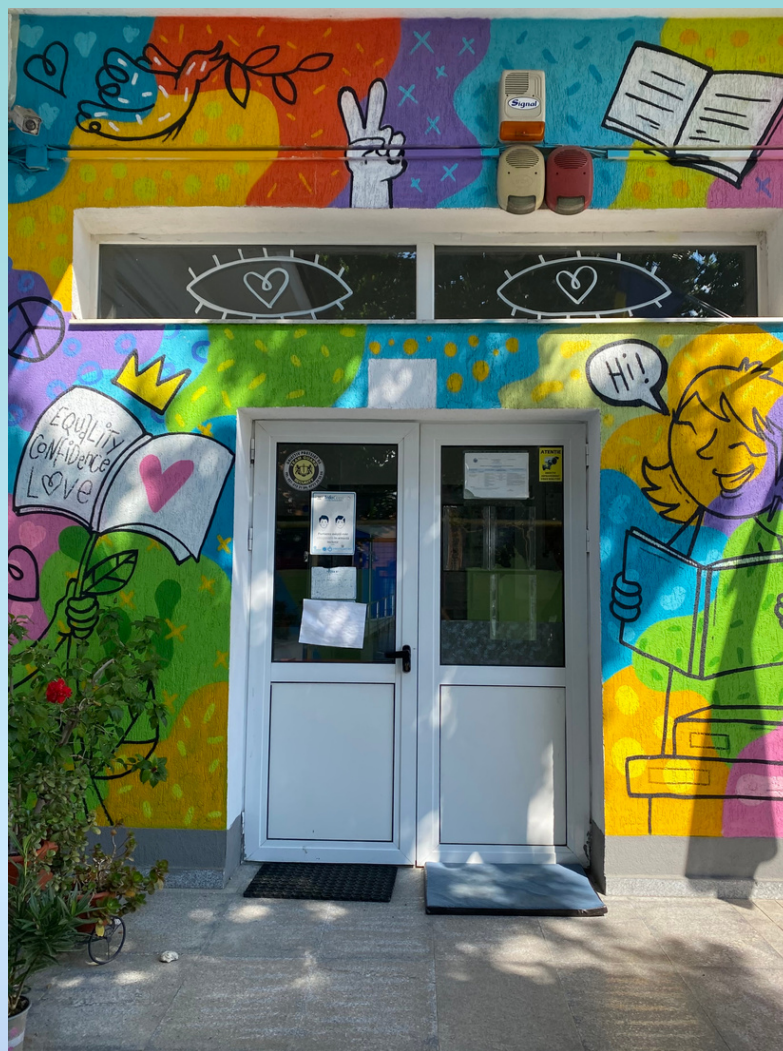
Scoala Speciala nr 9