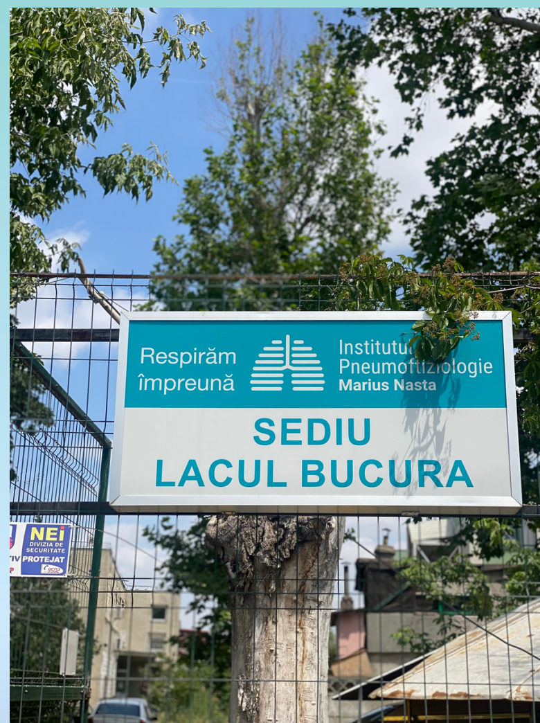
Sectia de Pneumoftiziologie Pediatică a Institutului Marius Nasta